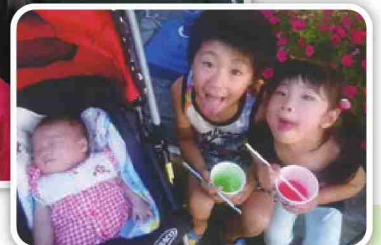
2年前に古川の夏祭りに行った時の一枚