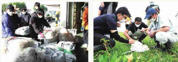
高ブリクスタックの一月使用

特色ある米生産のため、化学肥料の使用量や化学合成農薬の使用量を従来の約1/2とした「環境保全米」への取り組みや、農業生産過程で排出される二酸化炭素や節電率の高ブリクスタックを導入し、適正に処理することで環境に配慮した農業生産に取り組んでいます。また、田んぼの土まもの検査を通して田んぼや周辺環境の状況を把握し、地域の土まものや虫害系に関する情報を集め、環境に配慮した田んぼの管理に努めています。