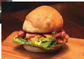
OSAKIバーガー 500円 (税別) →

赤いレンガが目を引く外観。大きなバーカウンターとBOX席がある店内では、ジャズや1940年代のポップスが流れます。昔の船内をイメージし、木を中心とした作りや間接照明がお落ち着いた雰囲気演出しています。2階は100人が利用できるオープンスペースです。