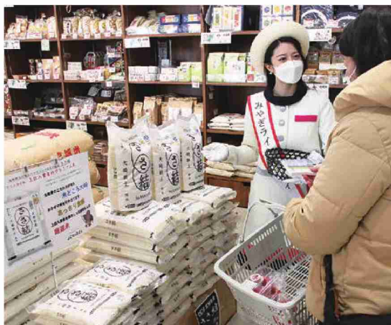
来店者(右)に「ささ結」の魅力を紹介するみやぎライシーレディ

JAと全農宮城県本部は3月1日、道の駅おさきで米の販促イベントを開き、「ささ結」の更なる認知度向上を図りました。