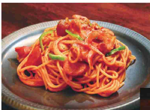
↑ 懐かしのガロオー風