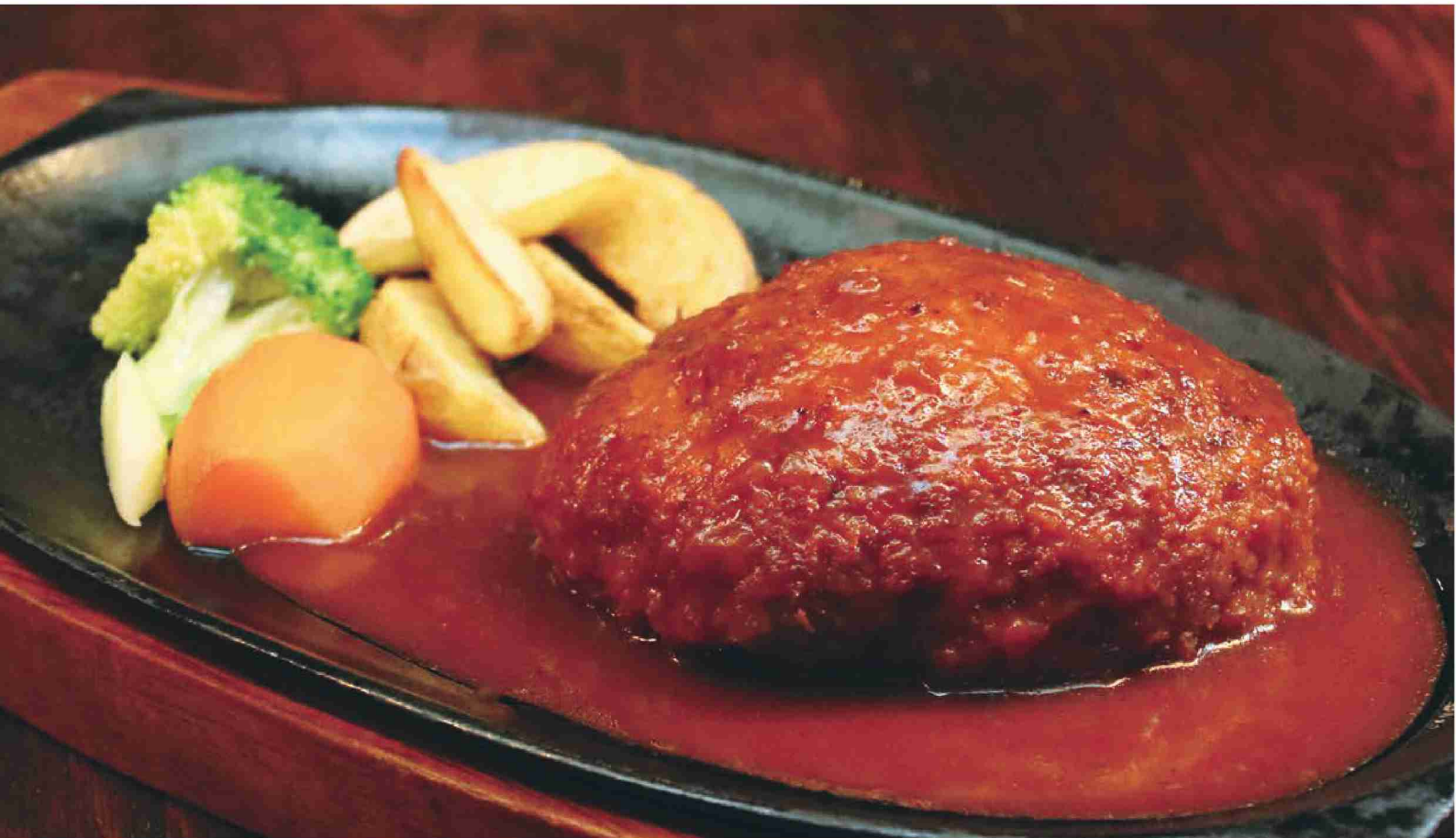
特製 鉄板ハンバーグ (牛肉100% 200g) 950円 (税別)