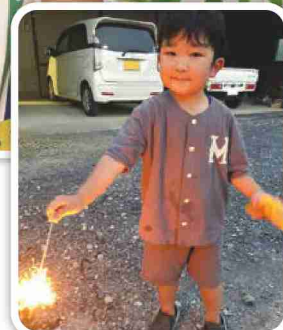
今年の夏にいとこ達と花火をした時の一枚