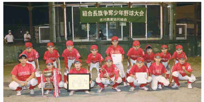
準優勝の大崎シルバースターズ