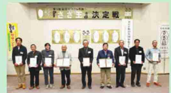
昨年の受賞式の様子