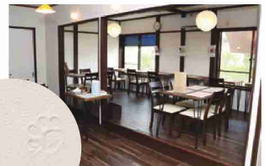
個別席も充実しており 一人でもゆっくり過ごせる店内。 壁には愛犬じょんの足跡が!?

絶品料理と気さくな店員さんが迎えてくれる空間で、ゆったりとした時間を過ごしてみたいいかがでしょうか。