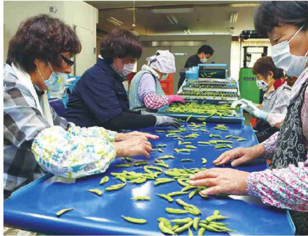
転作エダマメの調整作業をする作業員

JA管内で7月31日から転作エダマメの出荷が始まりました。同日からJAの共同調整所が稼働しており、生産者が機械で収穫したエダマメを共同で洗浄・選別し、生産者の作業省力化を図っています。