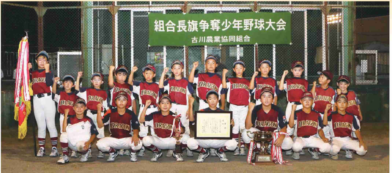
4度目の優勝を飾った大崎ジュニアドラゴン

JAは8月20日と23日、古川で第15回JA古川組合長旗争奪軟式少年野球大会を開き、管内のスポーツ少年団7チームが参加。2日間にわたり熱戦を繰り広げました。