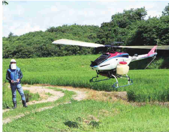
無人ヘリを操縦するオペレーター

JA管内で水稲の無人ヘリコプターによるカメムシ防除作業を実施しました。8月2日から8月15日までに2回実施し、延べ3046haを防除しました。