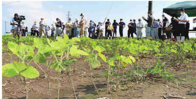
水害で下葉が落葉した大豆と検討会で説明を聞く生産者