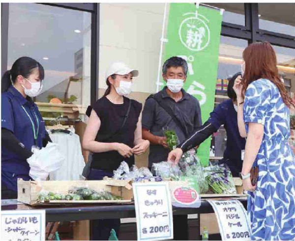
来店者(右)に野菜を販売する会員たち

野菜を購入した来店者は「「ぷらぷら」は初めて聞いたが、スーパーで売っている野菜より鮮度が良かったから購入した。珍しい野菜も調理方法を教えてもらったので早速食べてみたい」と話していました。