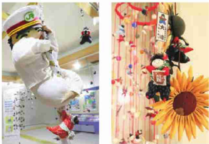
古川駅構内に飾られているつるし飾り

現在、つるし飾りは「古川駅構内」「あ・ら・伊達な道の駅」「まちの駅おおさき醸室(かむろ)」「道の駅おおさき」「道の駅三本木やまなみ」での公共の場に展示されています。そして取材時に作成していたつるし飾りは、大崎市役所新庁舎に飾られていますので、機会がありましたらご覧ください。