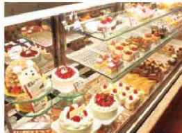
ショーケースに並ぶ色とりどりのケーキ

店内は、焼きたてパンの香ばしい香りと、色とりどりのケーキや焼菓子が所狭しと並んでいます。お客様の日常に寄り添い、彩を添える「ラ・パレット古川店」にぜひ足を運んでみてはいかがでしょうか。