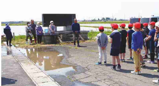
農家のお話を聞く児童たち

両地区にてご協力いただいた農家のみなさん、ありがとうございました!!そして、9月下旬から10月初旬に予定している稲刈り体験も、よろしくお願いたします!!