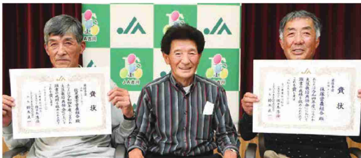
ミヤギシロメの部で 最優秀賞を受賞した 伏見要害営農組合