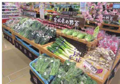
店内の産直コーナー