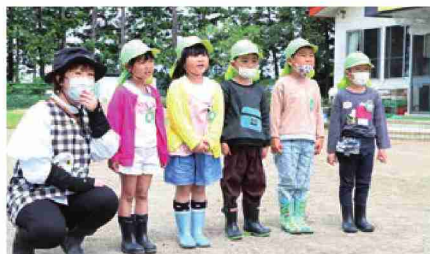
女性部員にお礼のあいさつをする園児たち