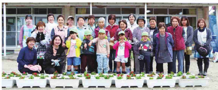
ベゴニア植え体験を終えたゆめのさと幼稚園の園児たちと先生、JA古川女性部長岡支部部長