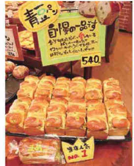
人気No.1メニュー 青豆パン 540円(税込)