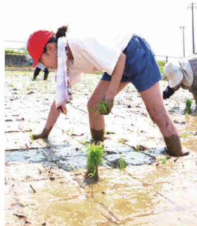
一生懸命植え付ける児童たち