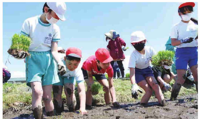
田植えを体験する児童たち