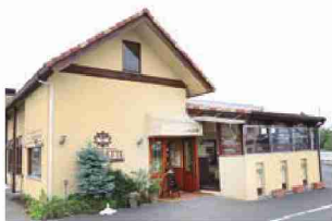
欧風の可愛らしい外観