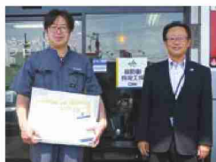
両部門で特別表彰を受賞した 丸高自動車株式会社の代表者(左)