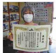
自賠責共済の部で特別表彰を受賞した 有限会社三鈴オートサービスの代表者