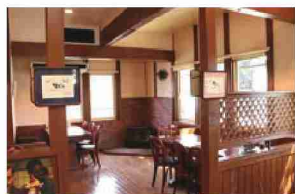
木を基調とした落ち着いた店内