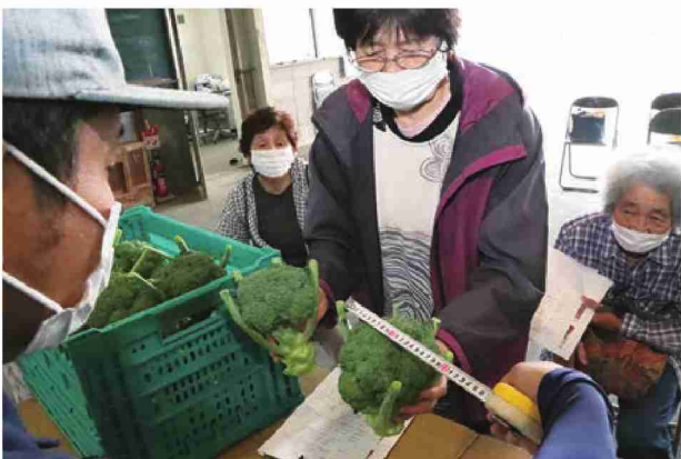
ブロッコリーの出荷規格を確認する生産者とJANA担当職員

JANAは6月9日、三本木野菜集出荷場でブロッコリーの出荷目揃い会を開きました。JANA担当職員が出荷形態や規格について調整を上演しながら説明しました。