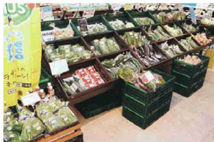
イオン古川店の産直コーナー