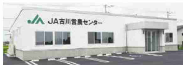
JA古川営農センター