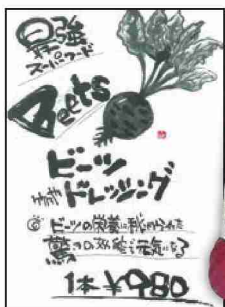
数量限定! 自家製ビーツのドレッシング 1本980円(税込)