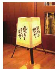
お客様を出迎える手書きランタン