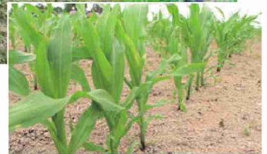
60センチほどに成長したとうもろこし