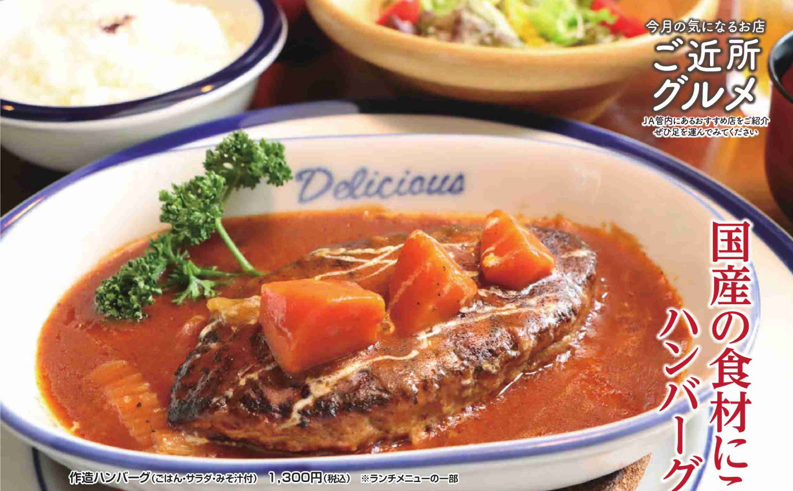
作造ハンバーグ(ごはん・サラダ・みそ汁付) 1,300円(税込) ※ランチメニューの一部