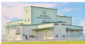
大崎市古川カントリーエレベーター