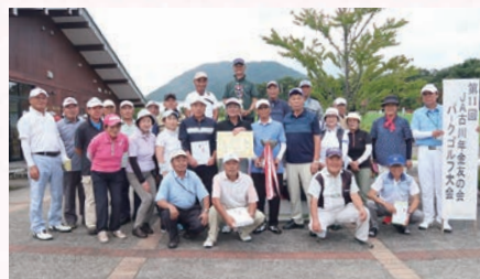
<JA古川パークゴルフ大会 優勝チーム>